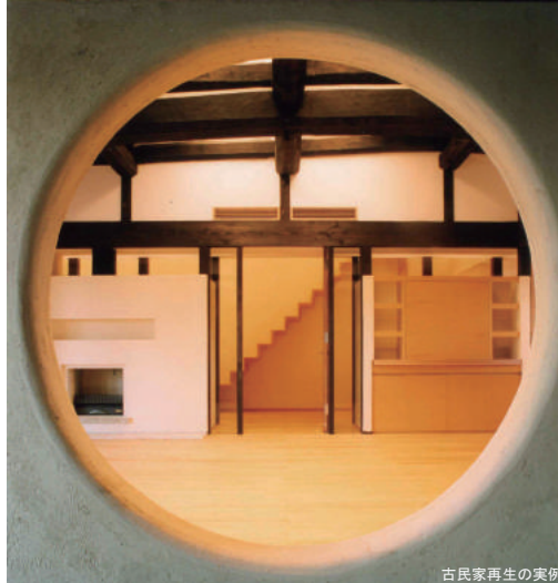
古民家再生の実例

日本の家は、古来から木を組んで建ててきました。伝統の木の家には、先人の知恵と工夫があります。さらに古民家の再生・利活用は時代の要請です。今回 15 期続いた「木組のデザインゼミナール」と好評だった「古民家再生ゼミ」を統合しました。講師は、「木造住宅【私家版】仕様書」執筆陣とゼミ OB と新進気鋭の建築家が担当・指導します。美しいデザインの架構と温熱環境の両方を備えたむかしと未来をつなぐ「木組の家」を学びませんか。