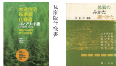
「民家のみかた調べかた」

■ お申し込み方法： 裏面の申し込み用紙に必要事項を、手書きでご記入の上、下記にFAX、メール、ご郵送ください。 ※会場定員 10 名で締切とさせていただきます。