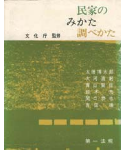
文化庁監修 「民家のみかた調べかた」

「民家のみかた調べかた」 調査手引書を読み解く どんな民家が古いか どのように調査をするか 調査の実例