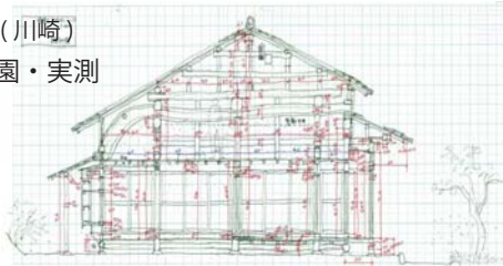
古民家実測の野帳

日本民家園・見学(川崎) 江戸東京たても園・実測 見学・実測研修 野帳の描き方 寸法の採り方 解体現場の研修