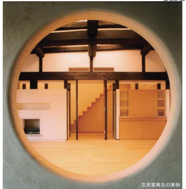
古民家再生の実例